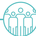
YSBRYD A CHYMUNED