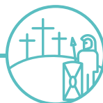
MESEIA A CHARIAD