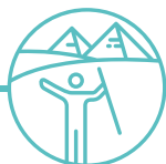
EXODUS A RHYDDID