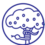
GWREIDDIAU AC YSTYR