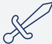
Cleddyf (un tegan)