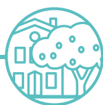
GOBAITH A CHARTREF